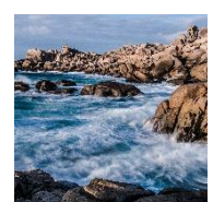
Reinigung & Heilung

Gönne Dir jetzt diese wunderbare Auszeit und sei dabei!